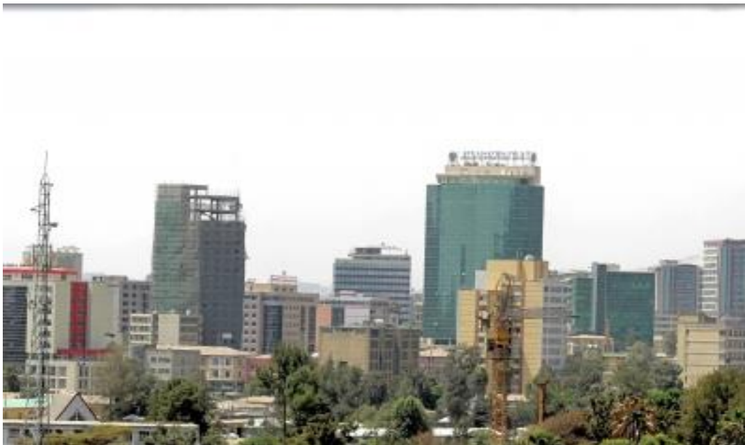
The new Addis that is the base for the bright future- The change is not coming easy, some scrupulous characters within the society are misleading the public to revolt as if the old Addis was heaven for them! In the end people will understand change is good and the government will weed out the scrupulous)