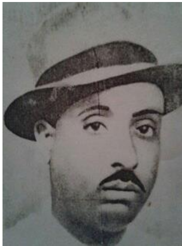
ተጻሕፊ፡ ብዕለት 14-12-2008