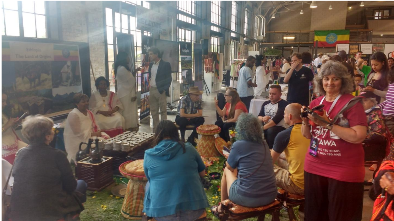
የቡና አፈላል ሥነስርዓት

ውዝዋዜና ፋሽን ሾው የባህላዊ ቡና አፈላል ሥነ-ሥርዓት፣ የባህላዊ ምግብ ዝግጅትና የተለያዩ የልጆች ፕሮግራሞች በማዘጋጀት አጠቃላይ የሃገር ገፅታ ግንባታ ፕሮግራም ለታዳሚዎች አቅርቧል።