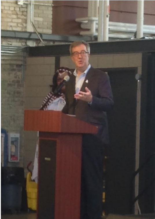
የተከበሩ ጂም ዋትሰን

አስመልክቶ የእንኳን ደስ አላችሁ መልዕክት አስተላልፏል። ከብርት አምባሳደር ብርቱካን አያኖ በካናዳ የኢ.ፌ.ዴ.ሪ መንግስት ባለሙሉ ሥልጣን አምባሳደር 26ኛው ዓመት የግንቦት 20 በዓል ምክንያት በማድረግ ባለሙሉ ንግግር ሃገራችን ባለፉት 26 ዓመታት በፖለቲካ ኤኮኖሚና ማህበራዊ መስኮች ያስገኘቻቸውን ድሎች እንዲሁም ኢትዮጵያና ካናዳ ግንኙነት ይበልጥ እየተጠናከረ መምጣቱን ገልጸዋል። ከዚህም በተጨማሪ ከካናዳ ግሎባል አፌይርስ ተወካይ የእንኳን ደስ አላችሁ መልዕክት አስተላልፏል።